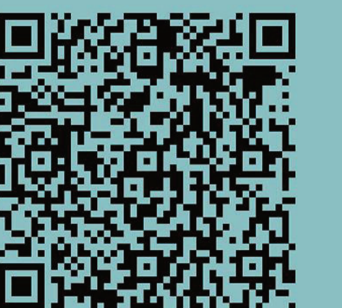
Podcast zur deutschen Kriegsvorbereitung

der Kriegsführung geschürt. Außerdem war und ist Faschismus ein Mittel zur Vorbereitung und Durchführung von Krieg. Das zeigte bereits der Zweite Weltkrieg, der in Deutschland von den Faschisten vorbereitet und geführt wurde. Einige Jahrzehnte später spielen auch in der Ukraine faschistische Akteure wie Swoboda oder das Asow-Bataillon eine wichtige Rolle und werden in der deutschen Öffentlichkeit als Helden gefeiert.