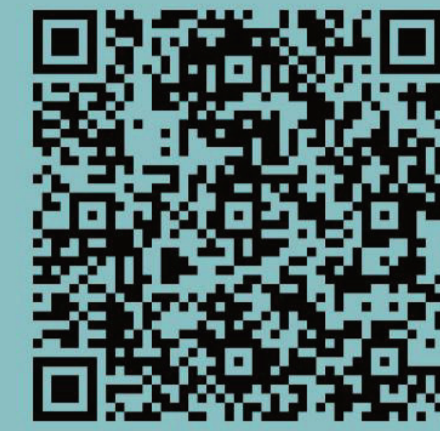
Thesen zum Ukraine-Krieg

Während Olaf Scholz den Begriff der Zeitenwende prägte, verkündete Boris Pistorius, dass wir bis 2029 kriegstüchtig werden müssen. Die Waffenlieferungen und die Waffenproduktion sind in den letzten drei Jahren enorm angestiegen. Waffenschmieden wie Rheinmetall fahren Milliarden Gewinne ein und der Staat stellt hohe Subventionen für neue Waffentechnologien zur Verfügung.