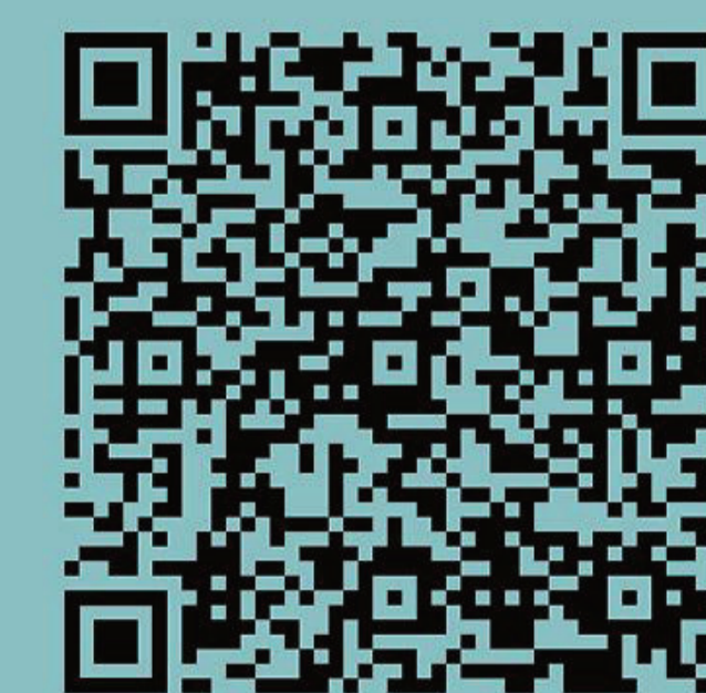
Broschüre zu Zeitenwende und Kriegsvorbereitung

Waffensysteme, für die aktuell noch das Know-How fehlen, werden aus dem Ausland besorgt. So sollen US-Mittelstreckenraketen in der Nähe von Wiesbaden stationiert werden, die mit einer Reichweite von 2500 km direkt Moskau treffen könnten. Da man nicht nur Waffen, sondern auch Personenmaterial benötigt, soll die Wehrpflicht wieder eingeführt werden. Mit dem neuen Wehrdienst wurde bereits ein Schritt in diese Richtung unternommen. Neben den durchgeführten Militärmanövern, die den Kriegsfall gegen Russland üben, wurde eine dauerhaft stationierte Brigade der Bundeswehr in Litauen beschlossen, um die „NATO-Ostflanke zu stärken“ (Pistorius). Um die Kriegsvorbereitung zu finanzieren, muss weiter umverteilt werden: Die Reallöhne sinken, im sozialen Bereich wird gespart und Sozialleistungen werden weiter gekürzt. Aber auch Maßnahmen zur Zwangsarbeit, Arbeitszeitverlängerung und eine Einschränkung des Streikrechts sind entweder geplant oder bereits umgesetzt.