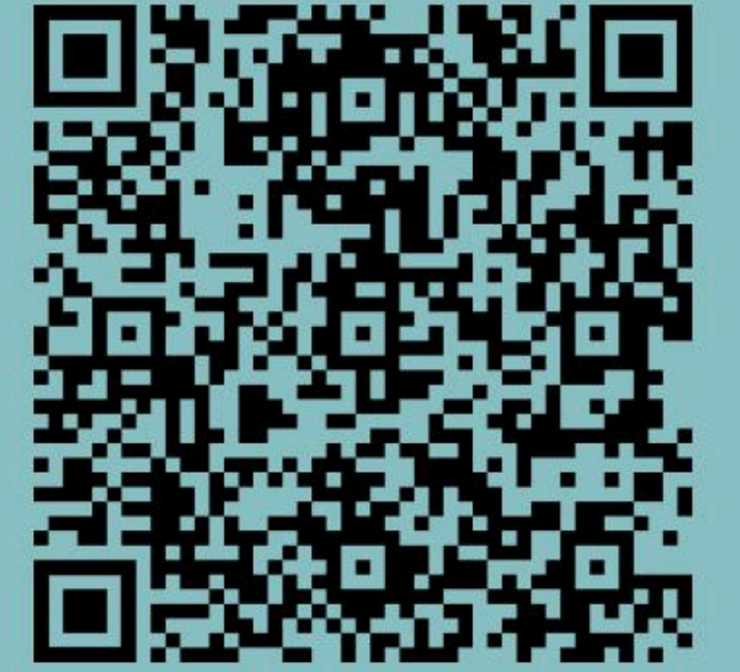
Thesen zum Ukraine-Krieg

Russland ist aufgrund seiner hohen Rohstoffvorkommen, seines großen Absatzmarktes und seiner Investitionsmöglichkeiten seit jeher für deutsche Großbanken und Monopolkonzerne interessant. 1990 stand mit dem Ende der Sowjetunion der Weg nach Osten wieder offen. Das EU-Projekt der Östlichen Partnerschaft entstand und sollte die deutsch-europäische Ausweitung absichern. Wenn also von der „Verteidigungsfähigkeit“ Deutschlands und der NATO gesprochen wird, ist damit die Ausdehnung deren Einflussbereiche gemeint. Russland steht dieser Ausdehnung im Weg und wird somit selbst zum Kriegsziel. Was Verteidigung genannt wird, ist eigentlich Angriff. Dies ist wichtig zu verstehen, denn die aktuelle Militarisierung und Kriegsvorbereitung werden mit der Lüge einer angeblichen Bedrohung Russlands legitimiert und vollstreckt.