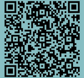
Thesen zum Ukraine-Krieg

Russland ist aufgrund seiner hohen Rohstoffvorkommen, seines großen Absatzmarktes und seiner Investitionsmöglichkeiten seit jeher für deutsche Großbanken und Monopolkonzerne interessant. 1990 stand mit dem Ende der Sowjetunion der Weg nach Osten wieder offen. Das EU-Projekt der Östlichen Partnerschaft entstand und sollte die deutsch-europäische Ausweitung absichern. Wenn also von der „Verteidigungsfähigkeit“ Deutschlands und der NATO gesprochen wird, ist damit die Ausdehnung deren Einflussbereiche gemeint. Russland steht dieser Ausdehnung im Weg und wird somit selbst zum Kriegsziel. Was Verteidigung genannt wird, ist eigentlich Angriff. Dies ist wichtig zu verstehen, denn die aktuelle Militarisierung und Kriegsvorbereitung werden mit der Lüge einer angeblichen Bedrohung Russlands legitimiert und vollstreckt.